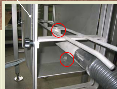
Kombiniertes Blasen und Saugen